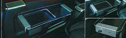
セカンドシートサイドテーブル

エグゼクティブパワーシートだけに備わるサイドテーブル用キットも追加。先端部にUSBポートが2口備わるなど、雰囲気を壊さない自然さと実用性に配慮した設計となっている。