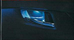
フロントドアハンドル

ドアハンドルの内側を淡く照らし出す間接照明。ドアまわりはとくに光が手薄な箇所であるため、かなり効果的。