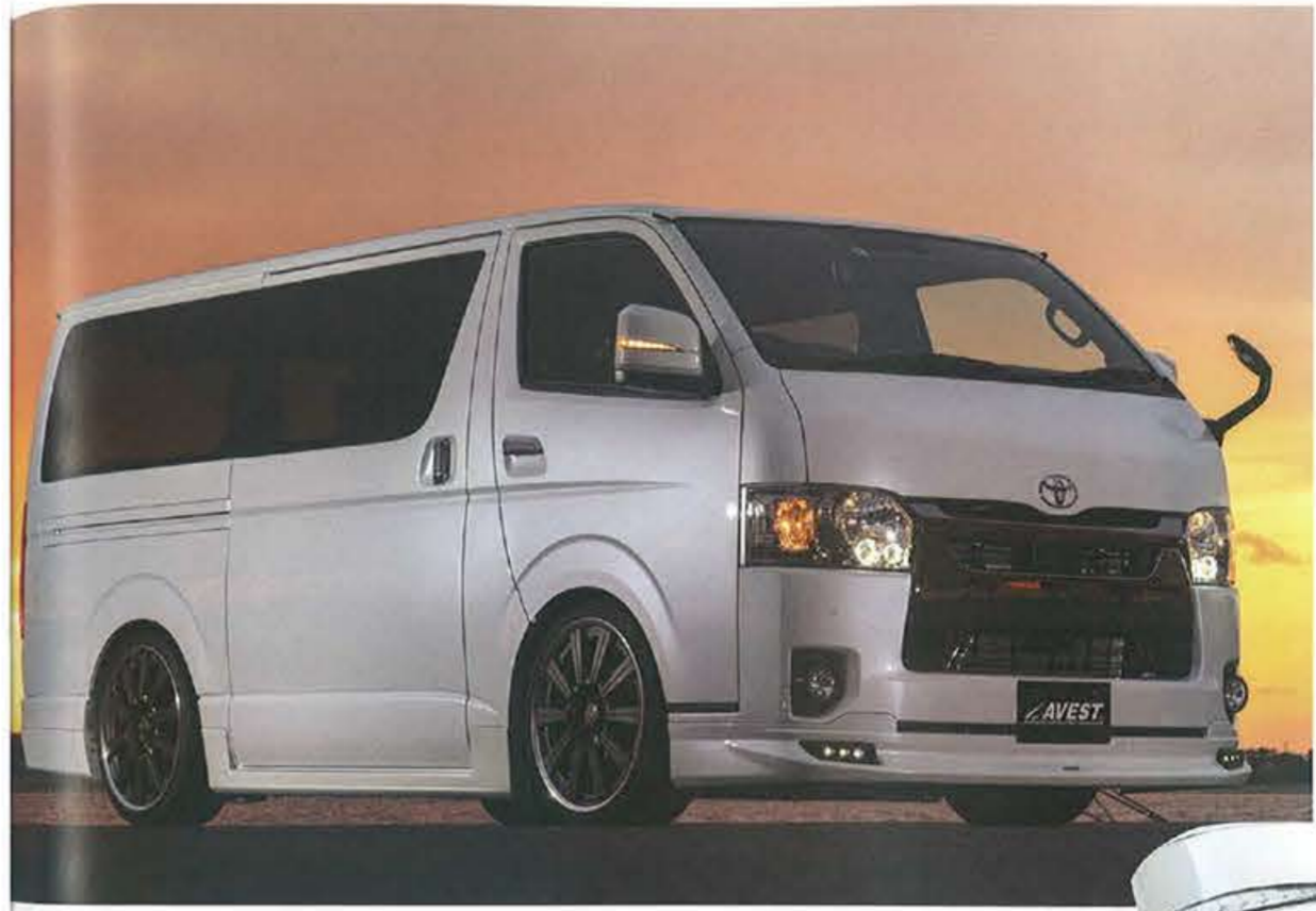
●純正ミラーに被せる方式のウィンカー内蔵カバーキット。このほかに、よりウィンカーのセグメントがくっきり見える「フロンソーールドインナー」タイプも用意している