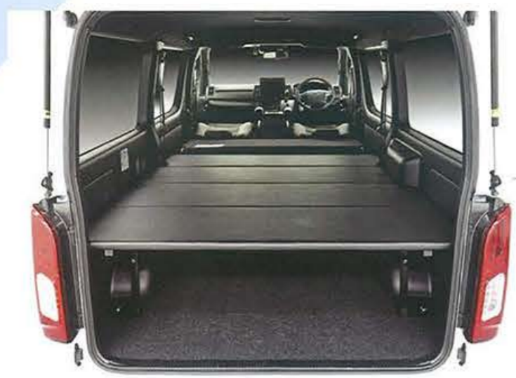
●ベースフレームに5段階の高さ調整機構も備えたベッドキットもラインナップ。この高さ調整を生かすことで、後席とつなげて荷室全面をフルフラットな空間として使える