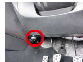
④ ステアリング左下下部にあるネジを取り外して下さい。