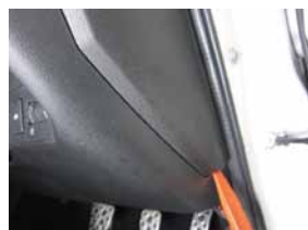
② パネル下部に内張り剥がし等を入れ、取り外して下さい。