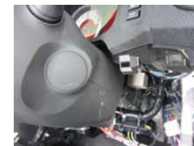
⑥ パネルが外れたら、ステアリングカバー横にあるグレーのリレーから電源を取り出します。