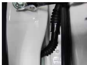
② ドアヒンジ下、室内へ繋がる部分に配線を通して行きます。