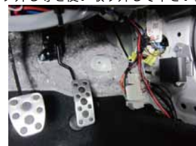
④ キックパネルが取り外し出来たら、室内ヘドアミラー配線を通して下さい。