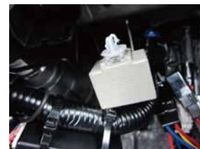
⑦ 内張り剥がし等でリレーを車両フレームから取り外して下さい。