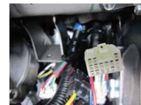
① 15ピンカブラー表側から見た写真