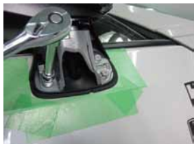
① ドアミラー本体を外し手順の逆で取り付けを行って下さい。