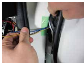
③ 配線が通しにくい場合は配線通し等を使うと通しやすくなります。 純正配線に傷を付けないように注意して配線して下さい。