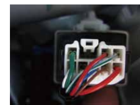
⑧ こちらから左右ウィンカー+電源を結線下さい。