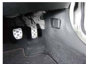
③ 足下奥キックパネルを取り外して下さい。奥にあるクリップをクリップ外し等を使い取り外して下さい。