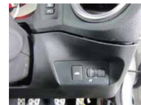
⑤ ステアリング下パネルを取り外して下さい。