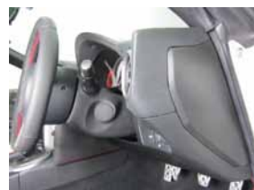
① 運転席横のパネルを取り外して下さい。