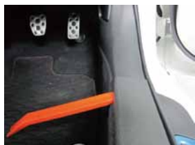
② 内張り剥がし等で持ち上げるように外して下さい。