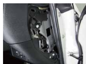
③ パネルが取外せたら下部にあるネジを取り外して下さい。

③ 結線が終わりましたら、点灯確認をし、異常がないようでしたら外したパーツを元に戻し取付完了です。