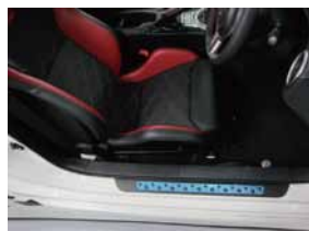
① 足下スカッププレートを取外して下さい。