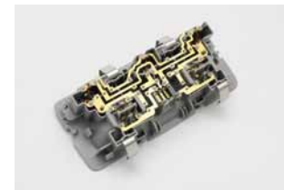
ルームランプユニットを外します。