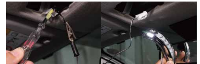
カプラーの部分にテスターを使い、ルームランププラス/マイナスの配線を探します。右図は端子を仮差しし、点灯確認を行っている画像です。