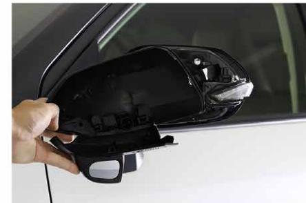
①ミラーカバーを外します。