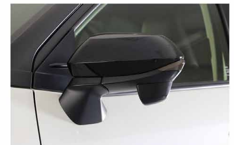
④カバーを戻して取付完了です。