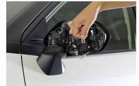
②純正ドアミラーウインカーを外します。