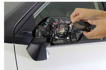
③製品を取り付けます。