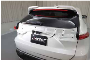
⑨リアゲートのガーニッシュ部分を取り外します。