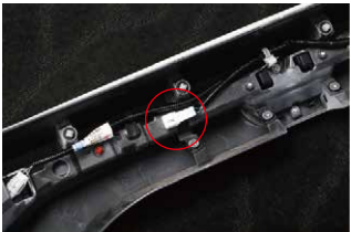
⑩取り外したガーニッシュ裏のコネクタにリアハッチ側ハーネスを接続し、ガーニッシュを取り付ける際に車内に延長配線を引き込みます。