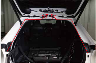
⑥ブレーキランプ側ハーネスをトランク内張りを通してリアゲートまで引き込みます。