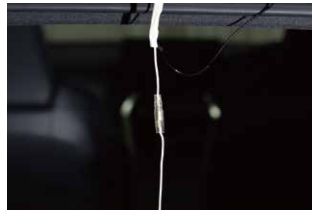
⑪ブレーキランプ側ハーネスとリアハッチ側ハーネスを接続します。