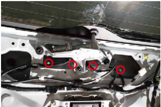
⑧ボルトを4箇所取り外します。