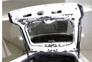
⑦配線を通した状態です。