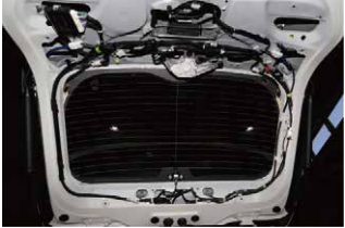
⑤リアゲートの内張りを内張り剥がしなどで剥がします。