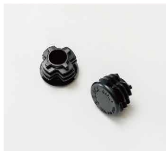
⑥エンドキャップ 2個