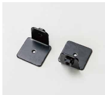
②バックドアプレート 2個