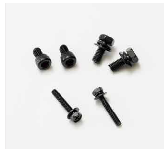
④アプセットボルト