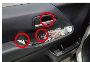
③赤○3箇所のボルトを取り外してドアの内張りを外します。