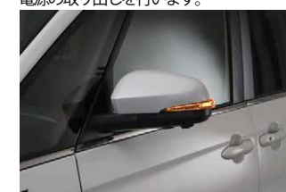
⑲点灯確認をし、問題がないようでしたら外したパネル類を元に戻して作業終了です