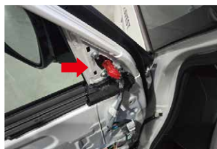
⑤3つのナットを取外し、ドアミラーを取り外します。