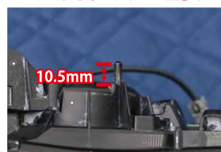
⑪画像部分の突起を根元から10.5mmの高さになるように先端をカットします。