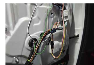
⑱電源の取り出しが終わったら製品の配線と延長配線を接続します。