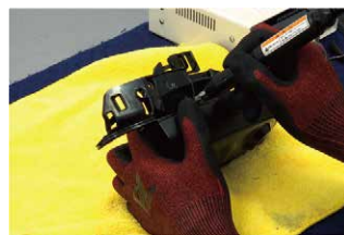
⑩超音波カッターなどを使って左図の赤い部分をカットしてください。

ドアミラー取付は非常に複雑な作業を伴います。自信の無い方は必ず整備業者様等での取付をお願い致します。