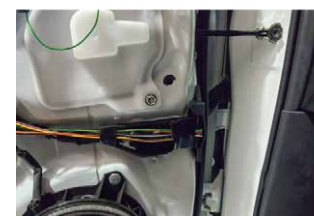
⑮製品に付属している延長配線を用意し、車内へ配線を通していきます。