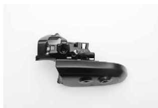
⑨下部カバーを次の図を参考にカットします