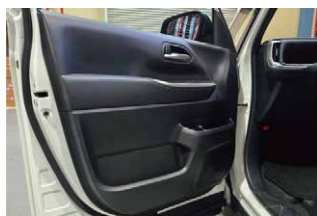
①ドアの内張りを外していきます。