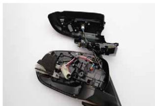
⑧下部のカバーも取り外します。