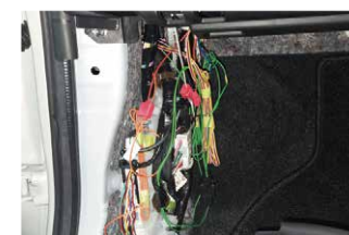
⑯助手席キックパネル内から延長配線を引き込み、ページ1の配線説明を参考に電源の取り出しを行います。