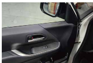
②ウインドウスイッチ・ドアハンドル内・ドアトリム上部のカバーを外します。