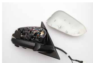
⑦ミラーレンズを外し、内側から爪を押し、カバーを外します。