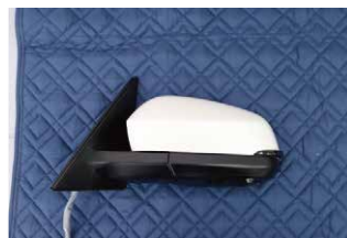
⑥ドアミラーカバーを取外します。