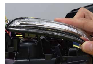
⑫製品のウinkerレンズ裏の筒の部分と、⑪で削った突起を合わせてセットします。