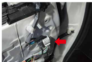
④白とグレーのコネクタを取り外します