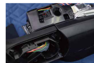
⑬モーター配線が通っている箇所へ製品の配線を通していきます。