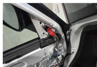
⑭外したカバーを元に戻してドアミラーを車輛へ取り付けしていきます。