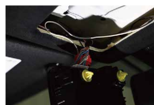
⑰フットランプ配線はルームランプユニット裏のカバーから電源を取り出します。