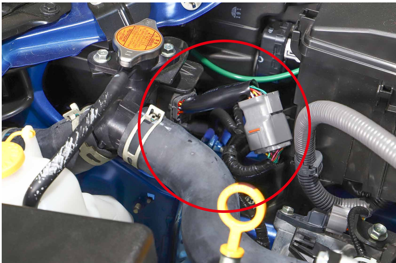
②商品を車体側と純正ハーネスの間に接続します。